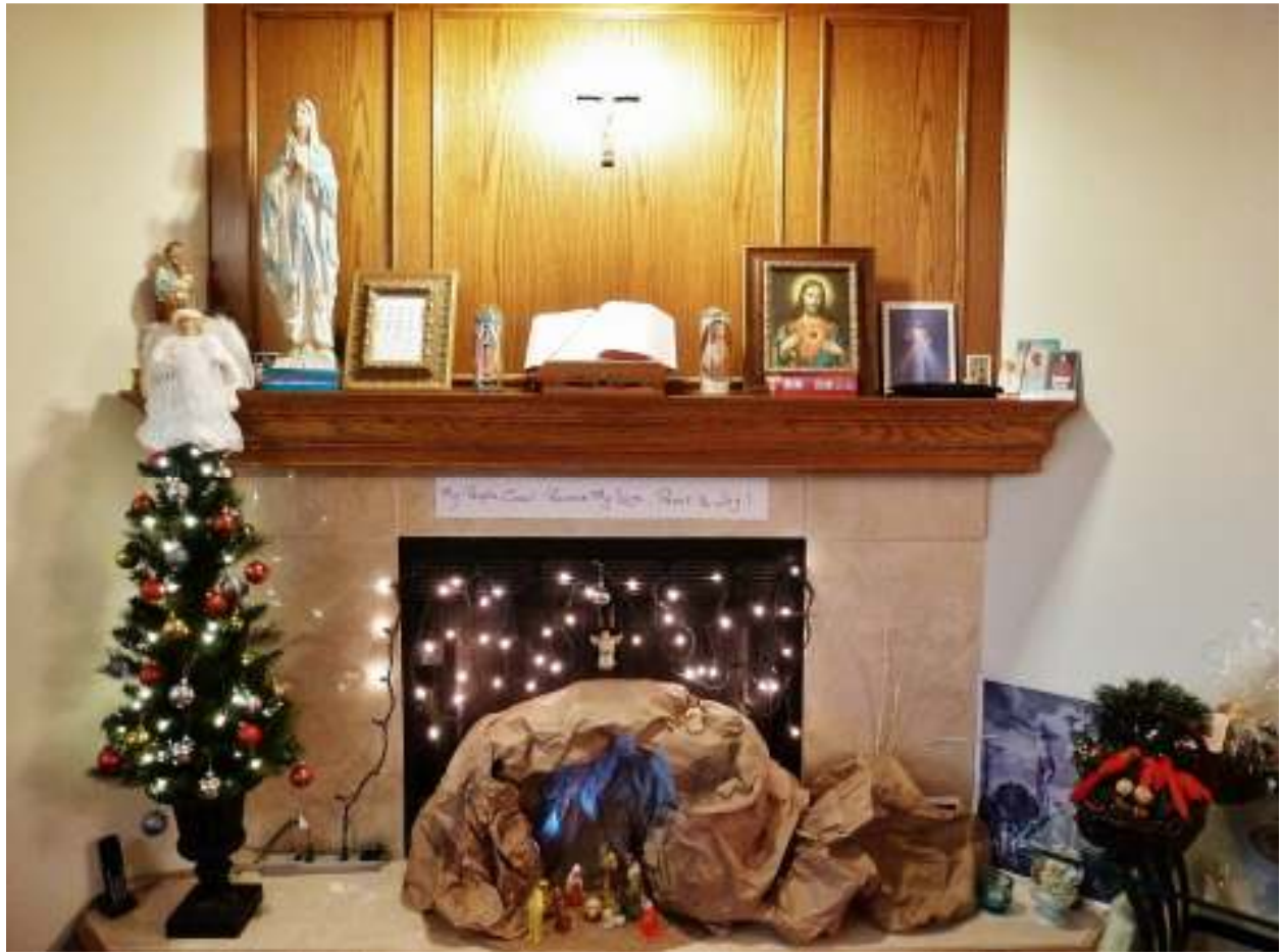
在慶祝耶穌聖誕的節期裡，我在壁爐前安放了自製的馬槽。

我把聖經恭放在中央位置，因為教會尊重聖經如同尊敬主的聖體一樣。按《天主的啟示教義憲章》第6章21條：