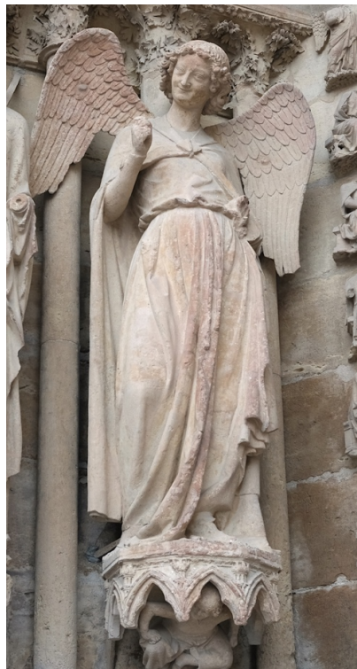
(圖二)「微笑天使」 蘭斯聖母主教座堂 (1236-1245)

又如圖二，在蘭斯聖母主教座堂外牆的天使帶着微笑，而在水天麥積山的石窟，就有菩薩與比丘在竊竊私語（圖三），他們上身微微前傾，肘、肩和頭部靠攏，仿佛在佛陀的循循誘導之下發出會心微笑。這些雕像看來非常親切，與以前的不盡相同。不同宗教卻有相同的方向，都是將神與人的距離拉近，從威嚴與懼怕的關係到溫和友善的愛護，讓人更容易接近宗教信仰的精神，與神聖接近。