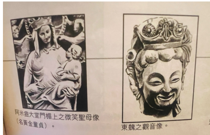
(圖一)《微笑的面容》劉河北著 公教真理學會 2000 (43 頁)

又如圖二，在蘭斯聖母主教座堂外牆的天使帶着微笑，而在水天麥積山的石窟，就有菩薩與比丘在竊竊私語（圖三），他們上身微微前傾，肘、肩和頭部靠攏，仿佛在佛陀的循循誘導之下發出會心微笑。這些雕像看來非常親切，與以前的不盡相同。不同宗教卻有相同的方向，都是將神與人的距離拉近，從威嚴與懼怕的關係到溫和友善的愛護，讓人更容易接近宗教信仰的精神，與神聖接近。